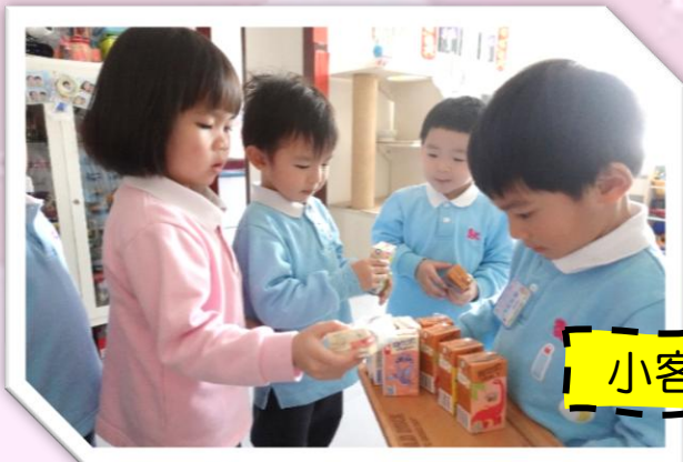
小客人也有禮貌，讚！