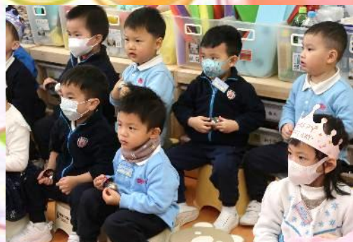
幼兒成為小樂手，一同打節奏。