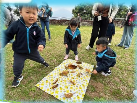
我們找到很多樹葉和樹枝喔