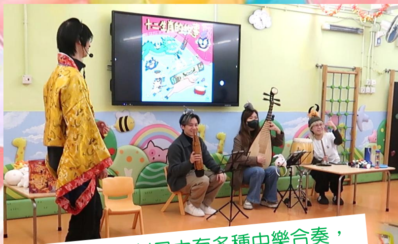
《十二生肖》劇目中有多種中樂合奏，配合劇情，讓幼兒認識和有不同感受。