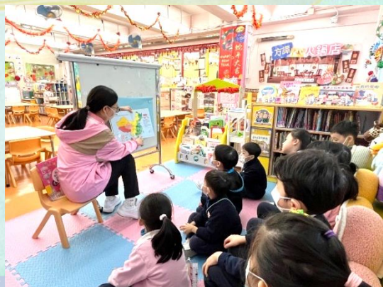
老師講述關於中國的故事。

老師透過閱讀中國特色的圖書，在向幼兒講述有關中國特色的事物時，幼兒對中國的文化、建築及美食等等有濃厚的興趣。故此引發幼兒對中國建築進入深入探索，展開專題研習之旅。