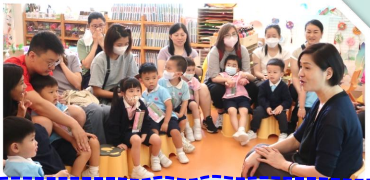
鍾校長歡迎家長，簡介觀課目的及內容