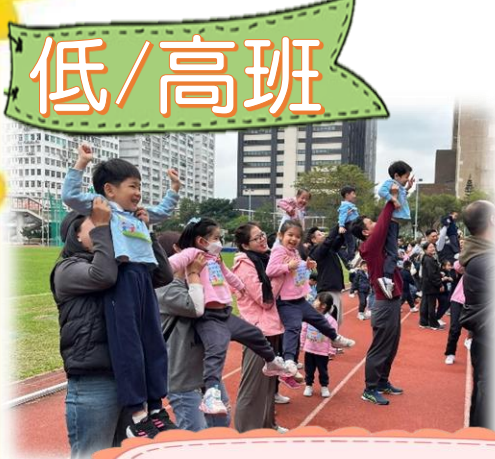
親子熱身及健康舞