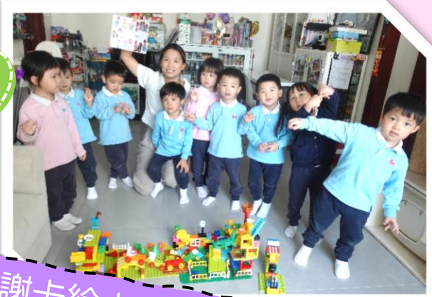
送上感謝卡給小主人和家人