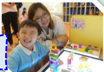
我和媽媽一同Plan, Do, Review 又教她入區角。叻叻呀！