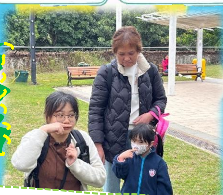
鼻子呼出二氧化「碳」

為提高幼兒的探索興趣，故安排專業導師帶領幼兒在大埔海濱公園進行探索活動，活動從收集樹葉、樹枝以了解樹能吸收二氧化碳再轉化成氧氣，與大自然玩遊戲。