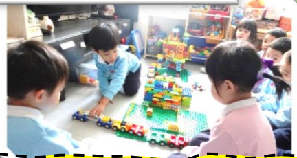
小主人十分好！ 與小朋友分享玩具和飲品