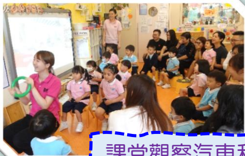
課堂觀察汽車和玩模擬遊戲！