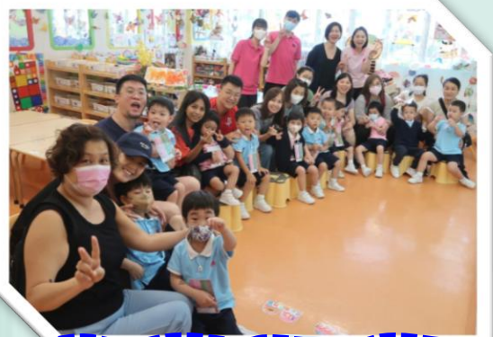
我們都愛爸/媽來觀課