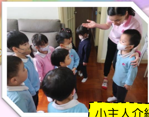
小主人介紹家中環境