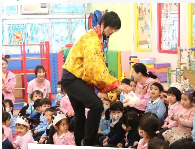
幼兒從劇情及互動過程，認識十二生肖的動物和由來。